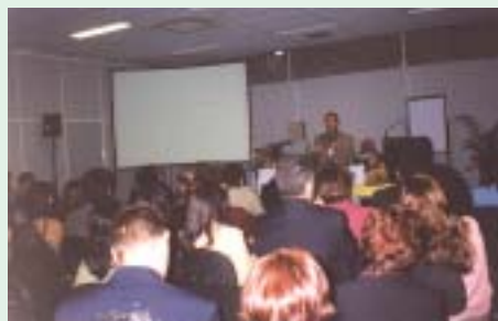
Outra perspectiva do auditório do mezanino durante a palestra "Legislação de Alimentos no Mercosul".